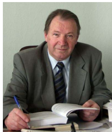
Мал. 18. Онищенко Олексій Семенович [108]

У 2002 р. О. Онищенко скерував колектив науковців на розробку моделі бібліотеки, що відбивала б вимоги ХХІ ст. У 1992-2002 рр. під керівництвом та з участю академіка О. Онищенка, а також доктор історичних наук В. Омельчука було розроблено концепцію національної бібліографії України. Дослідження, спрямовані на створення української національної