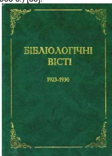
Мал. 20. Обкладинка покажчика Бібліологічні вісті (1923–1930) : систематичний анотований покажчик / укл. Г. І. Ковальчук. – К. : Абрис, 1996. – 160 с. [72]

Значну увагу бібліотека приділила удоступненню своїх фондів. У серії «Українська книга у фондах Національної парламентської бібліотеки України» вийшло два випуски каталогу «Україномовна книга, 1808-1923» (уклад. : Р. Жданова, В. Лой. – К. : Абрис, 1996. – 175 с.) та «Російськомовна книга ... 1816-1923» (уклад. : Р. Жданова, В. Лой. – К. : Глобус, 1999. – 365 с.) [35].